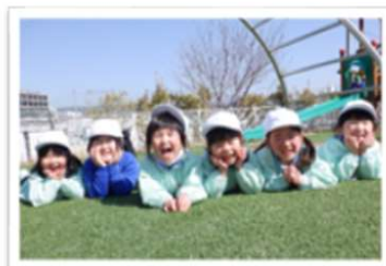
学園内に附属幼稚園